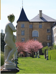
Grand-Château d'Ansembourg 10, rue de la Vallée L- 7411 Ansembourg www.gcansembourg.eu